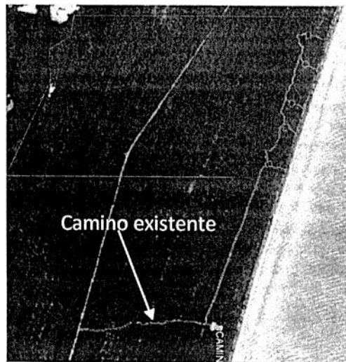
Imagen proporcionada por el promovente en la información adicional:

En la información adicional la promovente manifestó lo siguiente: que a fin de que el proyecto no afecte la zona núcleo de la Reserva, se presenta una propuesta de modificación del trayecto de acceso al proyecto, utilizando un camino existente ubicado a 500 metros al Este del polígono del predio, tal y como se observa en la imagen. De esta forma, ya no se requerirá de la apertura de un acceso por la zona núcleo, cumpliendo a cabalidad con lo señalado en las siguientes Reglas del Programa de Manejo de la Reserva en comento.